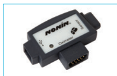
NONIN 1000 USB 1000USB