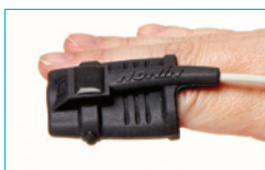
Soft Sensor Medium 8000SM