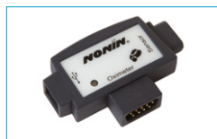
NONIN 1000 USB 1000USB