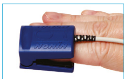
Adult Finger Clip 8000AA