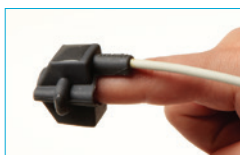
Soft Sensor Small 8000SS