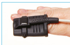
Soft Sensor Medium 8000SM