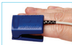
Adult Finger Clip 8000AA