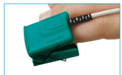
Pediatric Finger Clip 8000AP