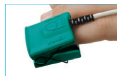
Pediatric Finger Clip 8000AP