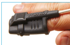
Soft Sensor Large 8000SL