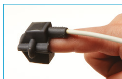
Soft Sensor Small 8000SS