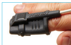
Soft Sensor Large 8000SL