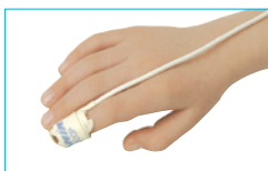
Engångssensorer Fler modeller